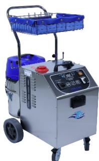
TCE C35/40/45/50 Stoomextractie stofzuiger 2 dopjes ontkalker op 3 liter water