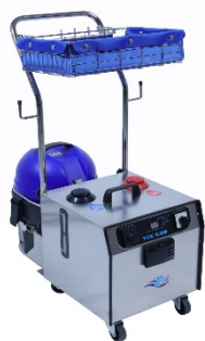
TCE C30 Stoomextractie stofzuiger 1 dopje ontkalker op 3 liter water