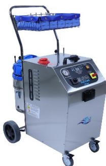
TCE C90 Stoomextractie stofzuiger 3 dopjes ontkalker op 5 liter water

De procedure van het ontkalken is niet veranderd!